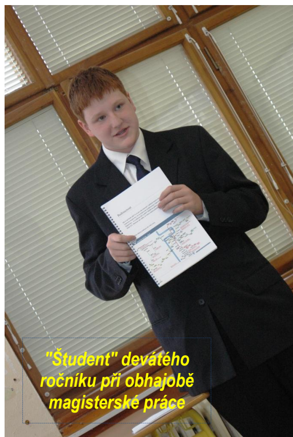
"Študent" devátého ročníku při obhajobě magisterské práce

Možná jste zaznamenali, že za tři a půl roku, kdy školu řídí nové vedení, se ledacos změnilo. Chceme, aby naše kunratická škola byla výbornou školou. Co pro to děláme? Snažíme se o kvalitativní proměnu školy. To je proces, který vyžaduje především čas. V něm probíhá cílené a plánované vzdělávání učitelů, kteří potřebují také vytvořit prostor pro svůj profesní rozvoj.